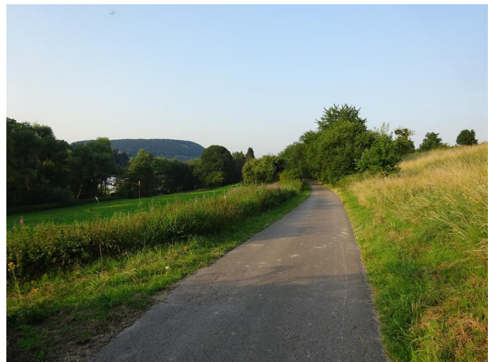
Zwischen Oberzissen und Niederzissen unterwegs im Brohltal.