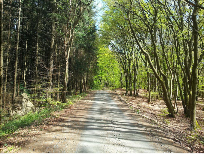
Durch den Wald fahren Sie abwärts in Richtung Hain.