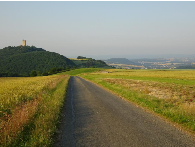
Hinter dem Wald öffnet sich der Blick zur Burg Olbrück und über das Brohltal.