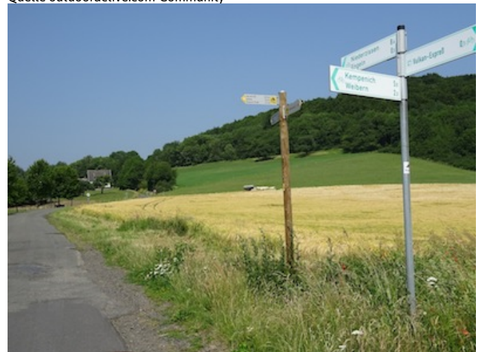
Direkt am Bahnhof treffen Sie auf das Wegweiser-System des Brohltal-Radwegs. Zunächst geht es bergauf in Richtung Engeln.