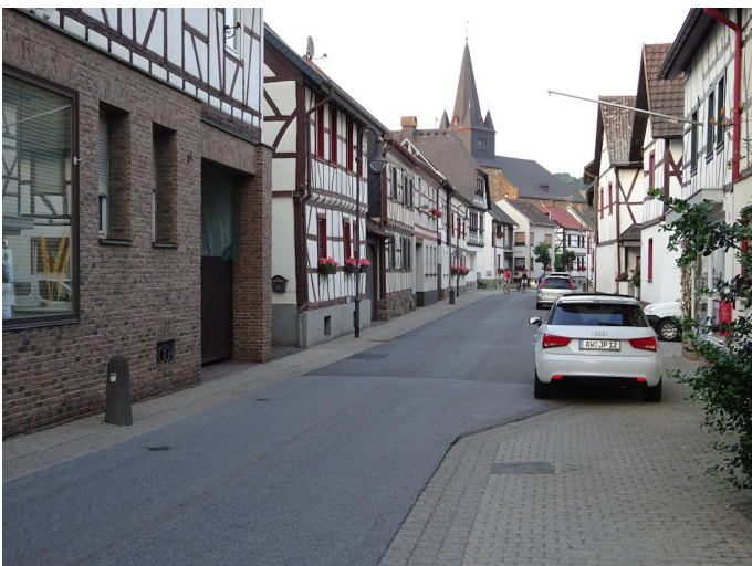
Ortsmitte von Waldorf.