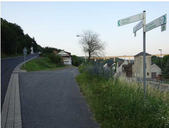
Der entscheidende Abzweig: rechts geht es entlang der Bahnleiße in Richtung Burgbrohl weiter, links bergauf führt der Weg nach Bad Breisig.