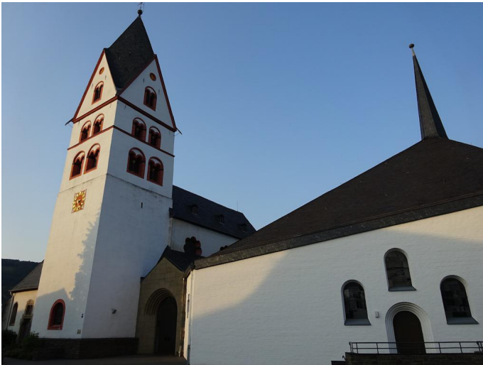
Entlang der Kirche geht es durch Niederzissen.