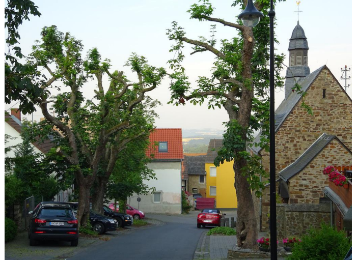
Nach dem Besuch der Burg Olbrück rollen Sie durch Hain weiter bergab. Autor Michael Hergarten Quelle outdooractive.com-Community