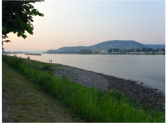
Das Rheinufer bei Bad Breisig ist erreicht.