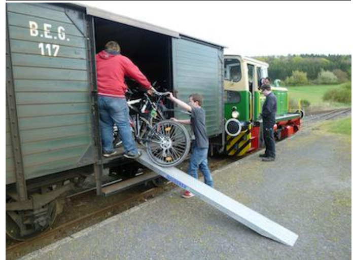
Am Bahnhof Engeln werden die Fahrräder aus dem Gepäckwagen der Brohltalbahn ausgeladen.