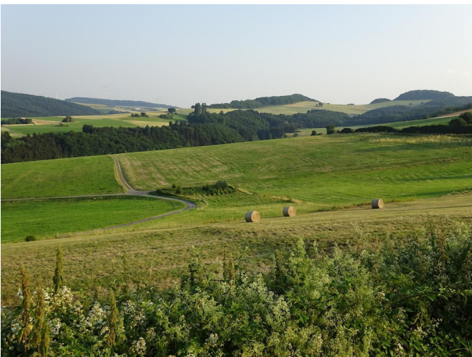
Blick zurück über die Hügel bei Brenk.