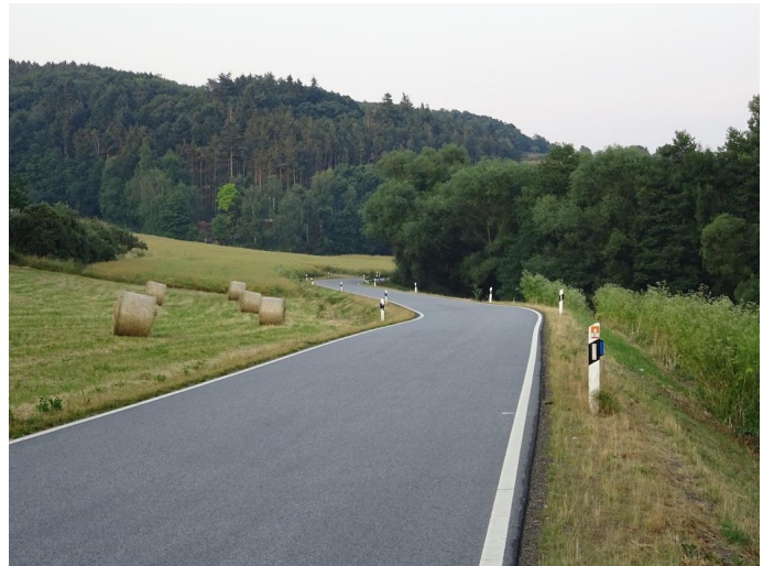
Die verkehrsarme Landstraße führt Sie durch das Vinxtbachtal nun bis zum Rhein.