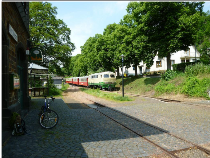
Am idyllischen Bahnhof Burgbrohl beginnt die 6. Etappe der Bahnwanderung.