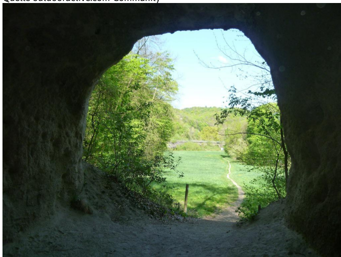
Nach einem Abstieg läuft man direkt durch die Trasshöhlen.