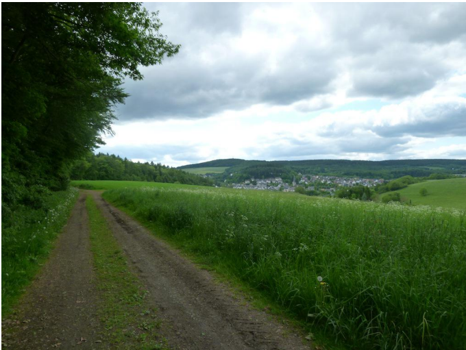
Am Waldrand entlang wird schon bald Kempenich erreicht.