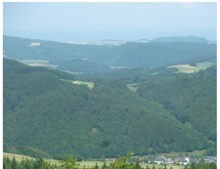
Vom Turm aus ist sogar die Burg Olbrück zu sehen.