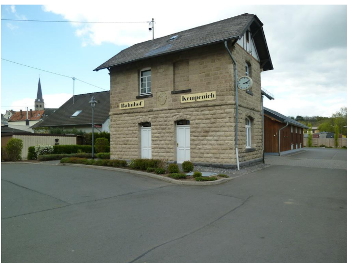
Der alte Bahnhof von Kempenich war bis 1974 Endpunkt der Brohltalbahn.