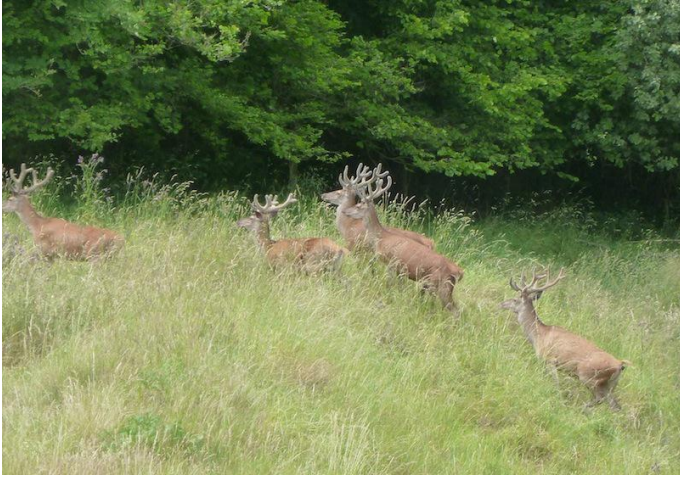
Natur pur im Pfingsttal hinter Hohenleimbach.