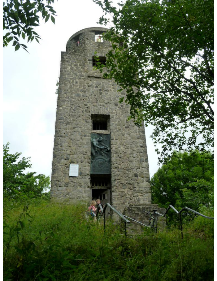
Der Kaiser-Wilhelm-Turm auf der 747 Meter hohen "Hohen Acht" markiert den höchsten Punkt der Eifel.