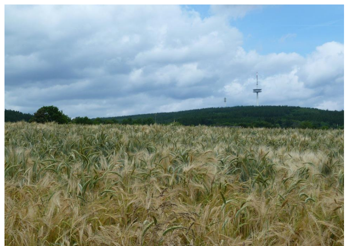
Am Wegesrand entdeckt man bei Lederbach den weithin sichtbaren Fernmeldeturm bei Cassel. Autor Michael Hergarten Quelle outdooractive.com-Community