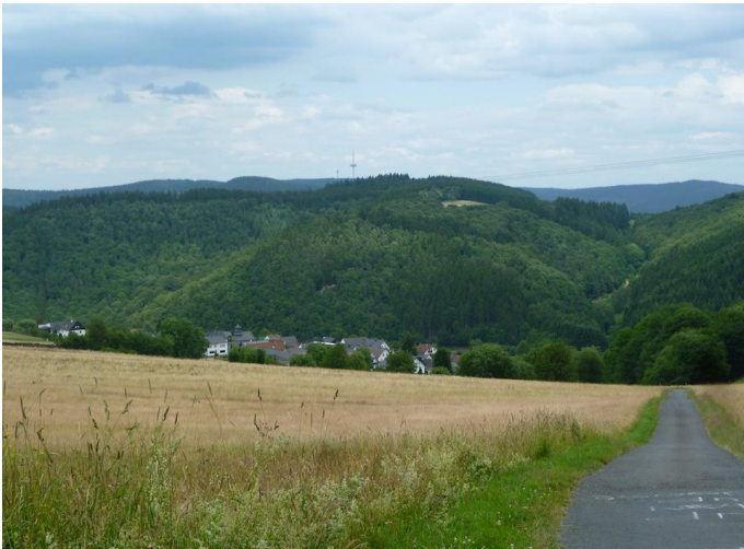
Blick zurück vom Hotel "Hohe Acht" auf den geschafften Anstieg von Jammelshofen.