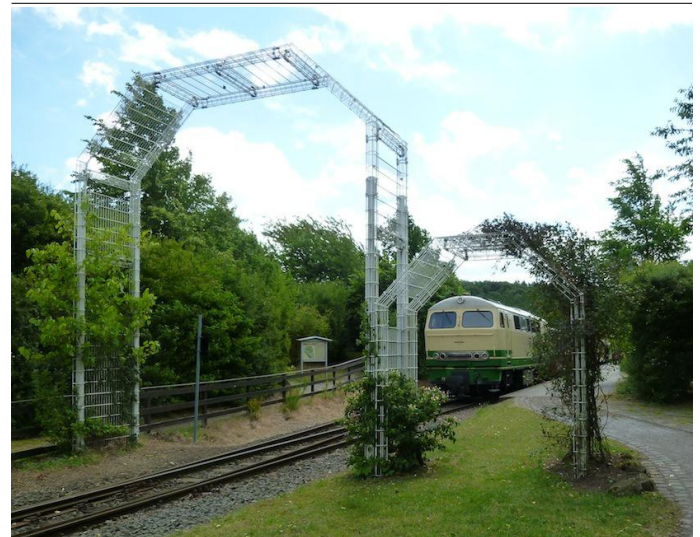
Nach der Ankunft mit dem Zug, verlässt man den Bahnhof Engeln durch ein beranktes "Tor".