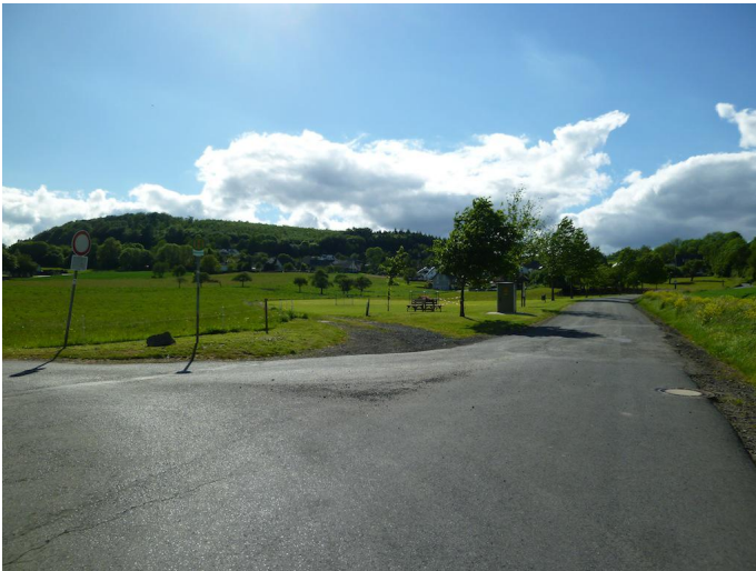
Über den asphaltierten Weg geht es bergan durch das Ortszentrum von Engeln.