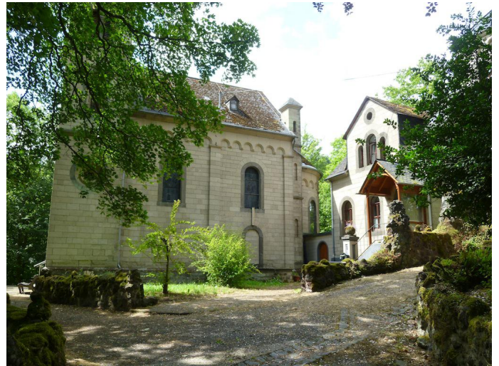
Im Kreuzwäldchen kommt man an der idyllisch gelegenen Kapelle vorbei. Autor Michael Hergarten Quelle outdooractive.com-Community