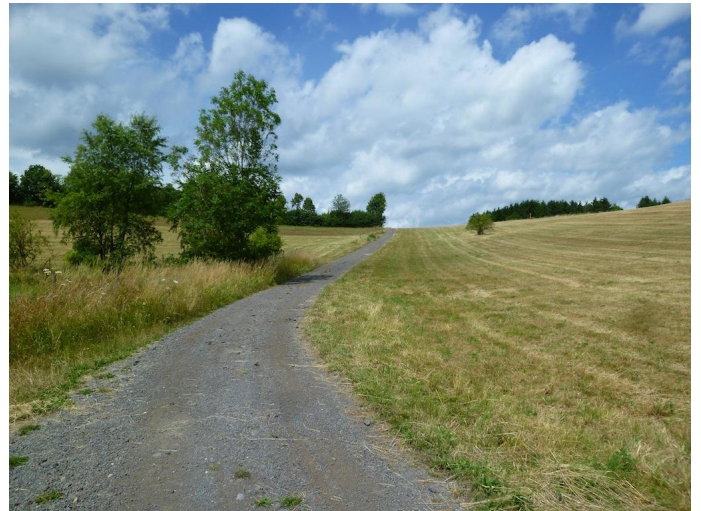
Leicht ansteigend geht es in Richtung Hohenleimbach. Autor Michael Hergarten Quelle outdooractive.com-Community