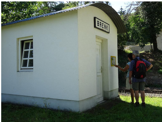
Am kleinen Bahnhof Brenk erreichen Sie wieder den "Vulkan-Expreß".