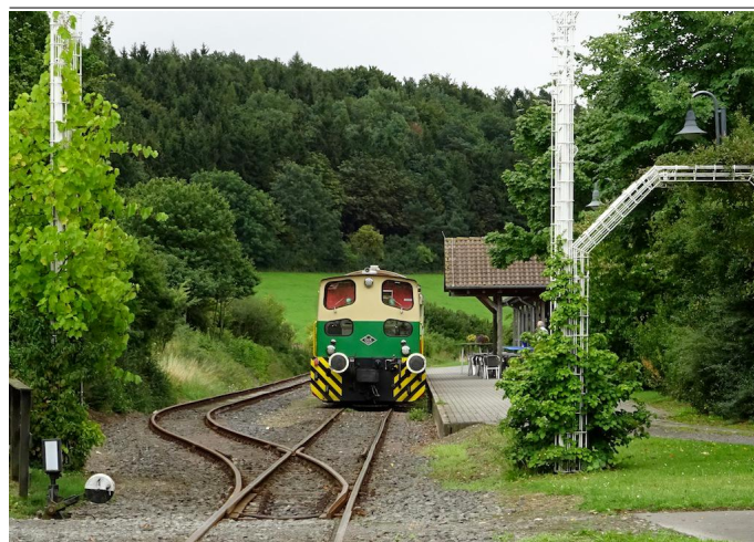
Vom Bahnhof Engeln aus beginnt die erste Etappe des Bahnwanderweges abwärts in Richtung Brenk.