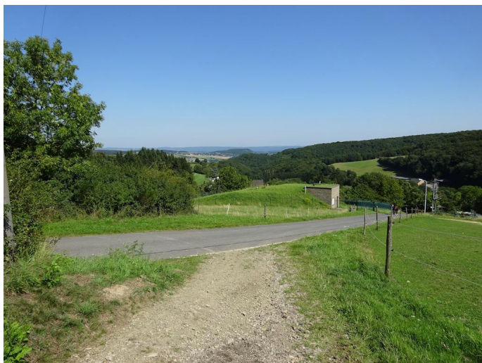
Aussicht oberhalb von Brenk.