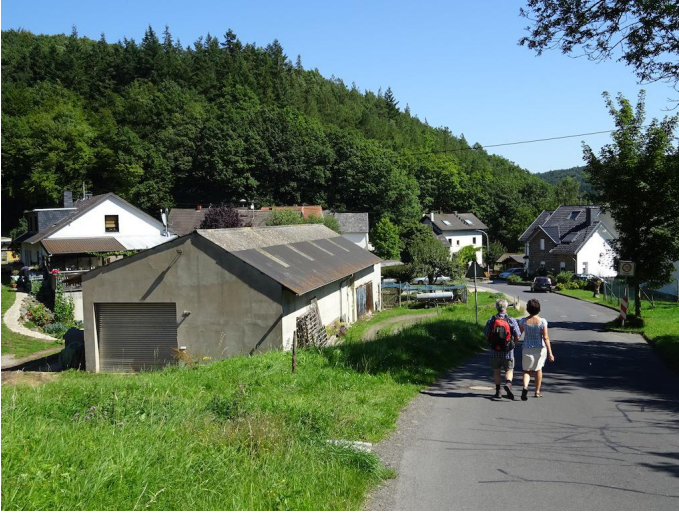
Schon bald ist die kleine Ortschaft Fußhölle erreicht.