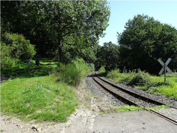
Ein kurzer aber kräftiger Anstieg führt direkt zu dem oberhalb des Ortes gelegenen Bahnübergang.