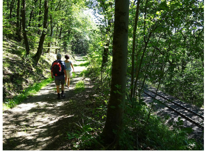
Durch den Wald geht es weiter abwärts.