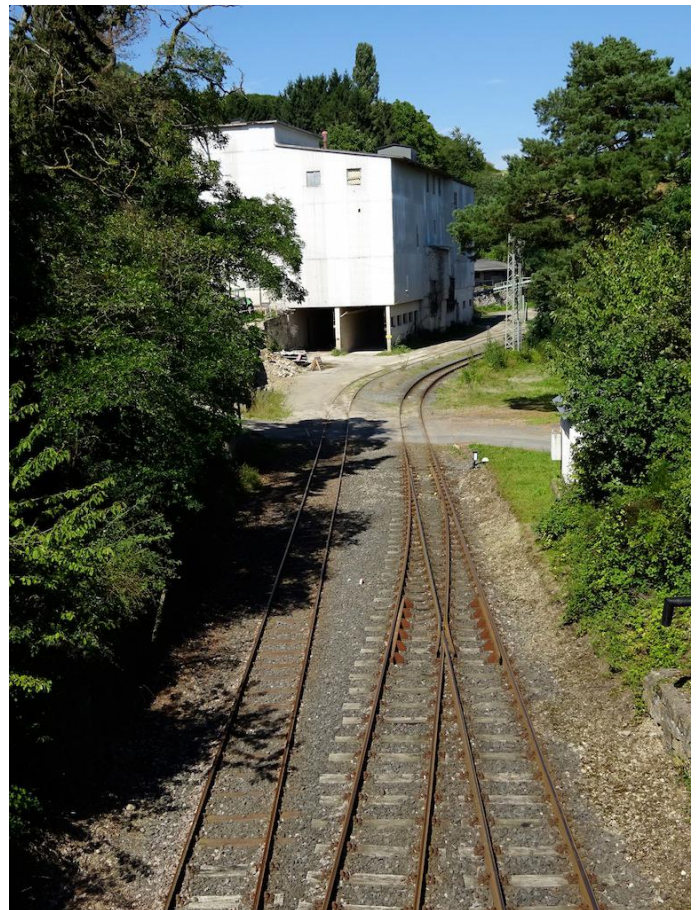
Blick auf die Werksanlagen am Bahnhof Brenk.