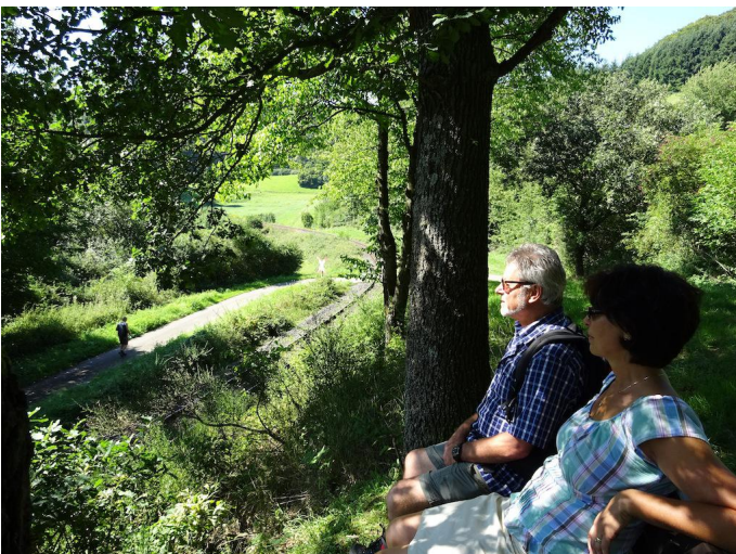
Verschnaufpause nach dem Anstieg oberhalb der Bahntrasse.