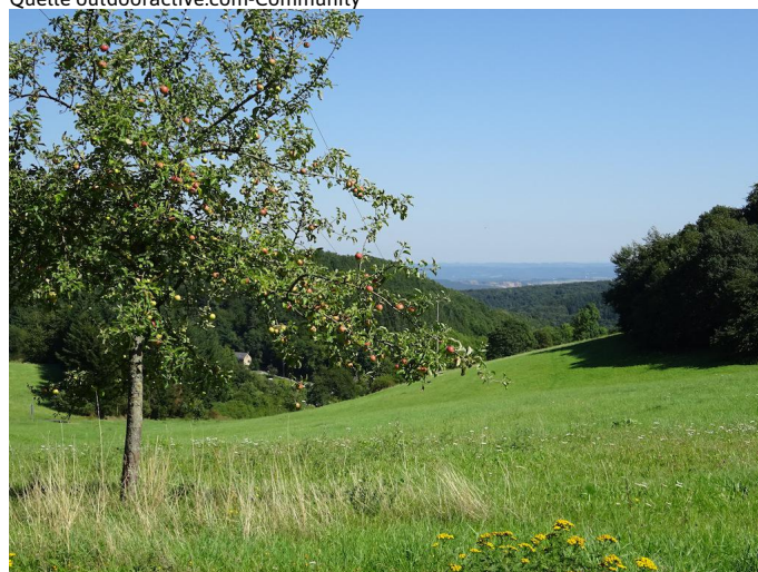
Von der abwärts führenden Straße haben Sie tolle Ausblicke über den Herchenberg bis zum Westerwald.