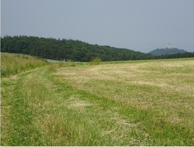
Blick zur Burg Olbrück