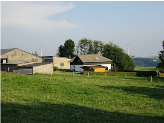
Die Rottlandhöfe Autor Michael Hergarten Quelle outdooractive.com-Community