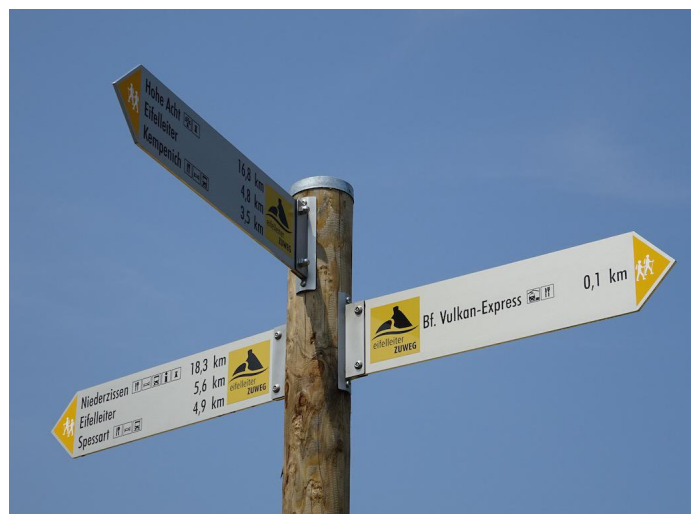
Folgen Sie dem Beschilderungssystem der Eifelleiter. Autor Michael Hergarten Quelle outdooractive.com-Community