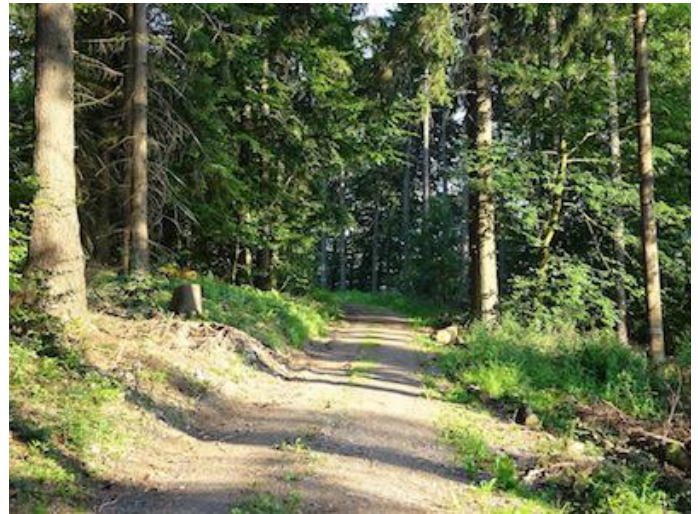
Im Wald am Engelder Kopf