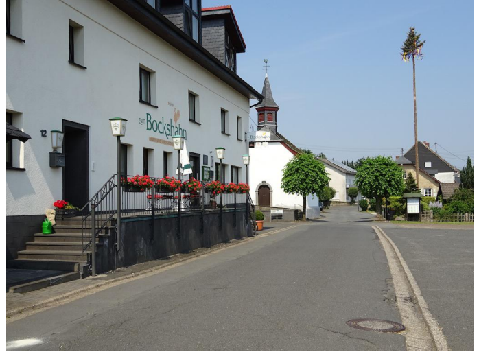
Ortskern von Spessart mit Landgasthof Bockshahn Autor Michael Hergarten Quelle outdooractive.com-Community