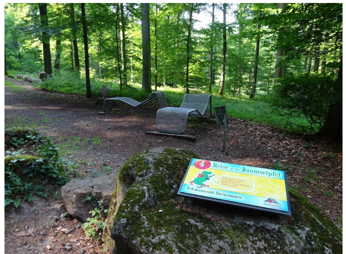
Im Erlebniswald Steinrausch Autor Michael Hergarten Quelle outdooractive.com-Community