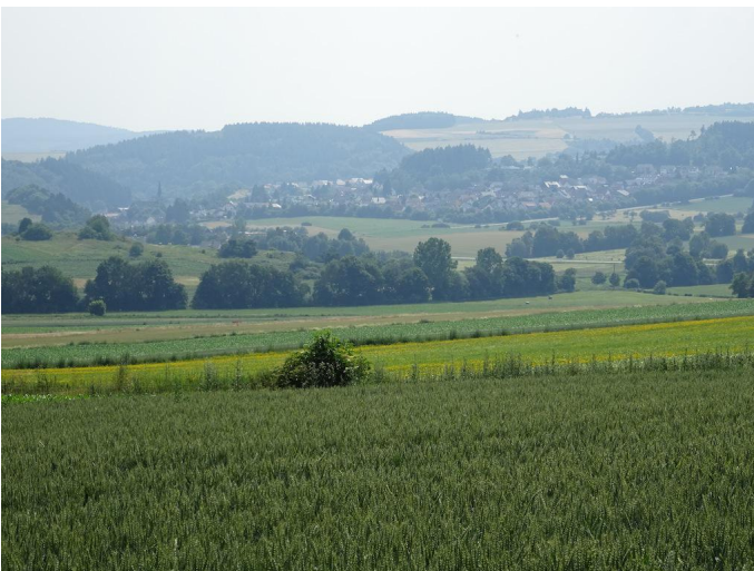
Blick über Kempenich Autor Michael Hergarten Quelle outdooractive.com-Community