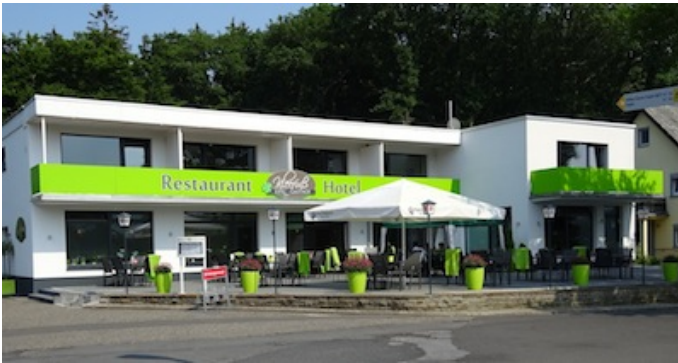
Direkt am Erlebniswald Steinrausch liegt der Eifel-Gasthof Kleefuß. Autor Michael Hergarten Quelle outdooractive.com-Community