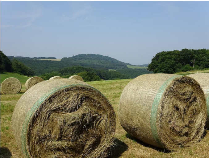
Auf dem Weg nach Spessart... Autor Michael Hergarten Quelle outdooractive.com-Community