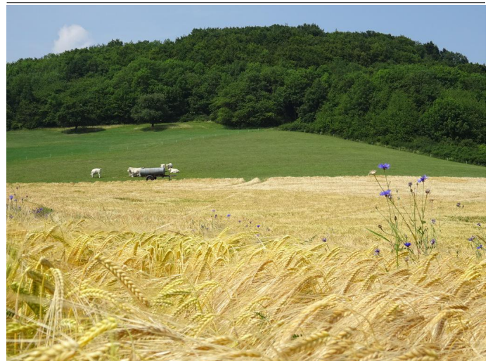
Sommer bei Engeln