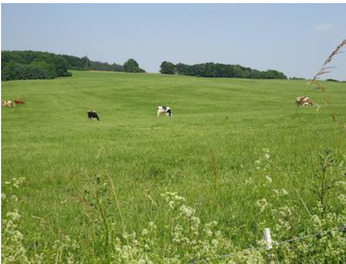
Durch ausgedehnte Weidelandschaften geht es Richtung Rottlandhöfe.