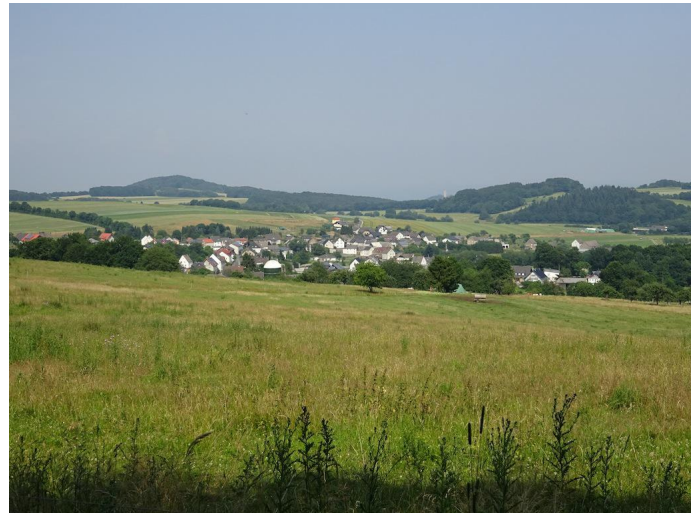
Blick vom Waldrand über Spessart und die Burg Olbrück