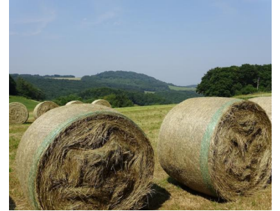
Unterwegs zwischen Spessart und Engeln.