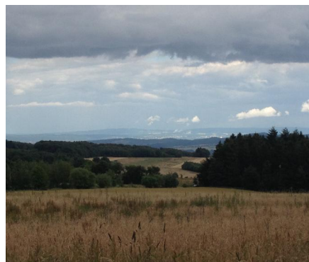
Fernblicke von der Eifelleiter in Richtung Westerwald.