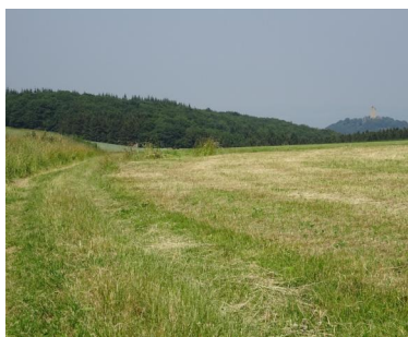
Blick zurück in Richtung Burg Olbrück.