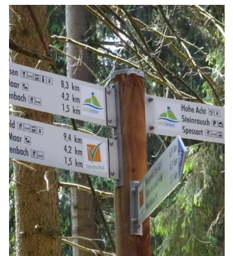
Das tolle Beschilderungssystem weist Ihnen auch in den tiefen Wäldern sicher den Weg!