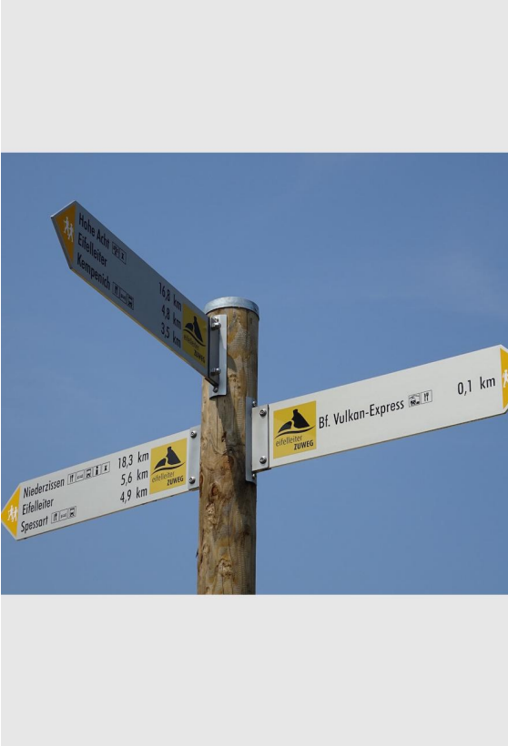
Der Bahnhof Engeln ist fast erreicht!