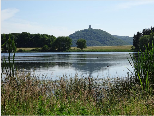
Burg Olbrück spiegelt sich im Rodder Maar.