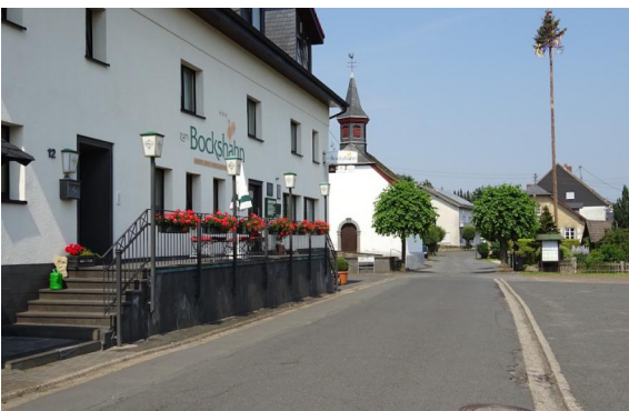
Das Ortszentrum von Spessart lockt mit dem Landgasthof Bockshahn.