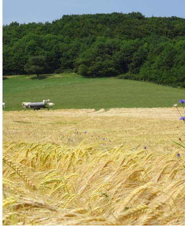
Sommer bei Engeln...