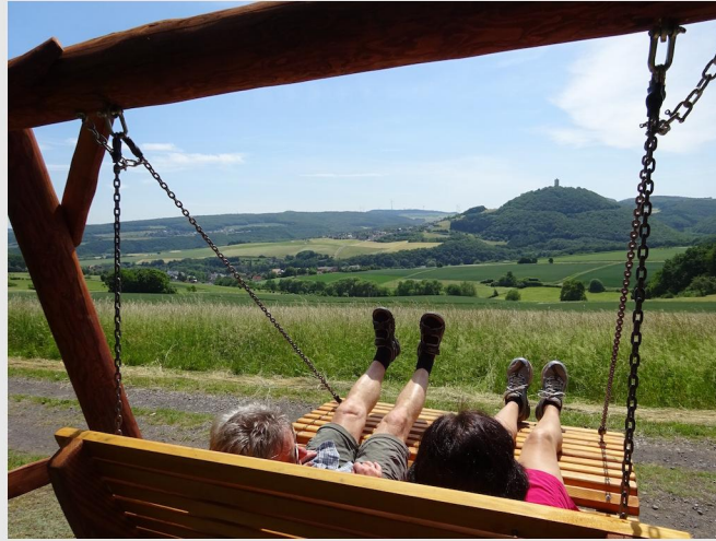
Entspannungsliege mit Blick auf die Burg Olbrück.