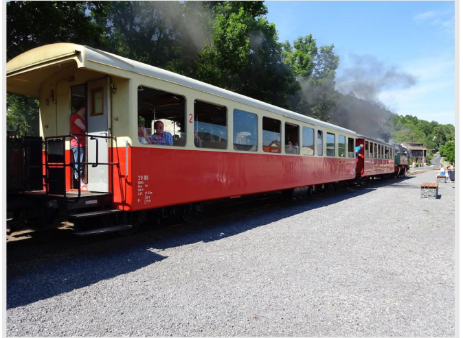
Mit dem "Vulkan-Express" erreichen Sie den Bahnhof Niedertzissen.