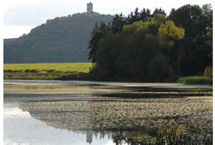
Autor Hans-Eberhard Peters Quelle Eifelverein e. V.