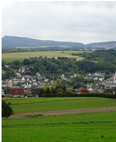
Blick auf Niedertzissen, im Hintergrund der Veitskopf. Autor: Michael Hergarten Quelle: www.brohltalbahn.de