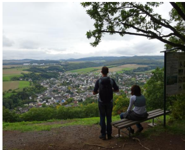
Ausblick vom Bausenberg über Niedertzissen und das obere Brohltal.