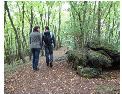
Entlang des Kraterrandes des Bausenberges führt der Weg durch Wald nach Westen.