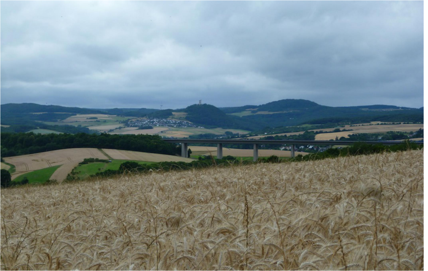
Blick über die Höhen in Richtung oberes Brohltal.