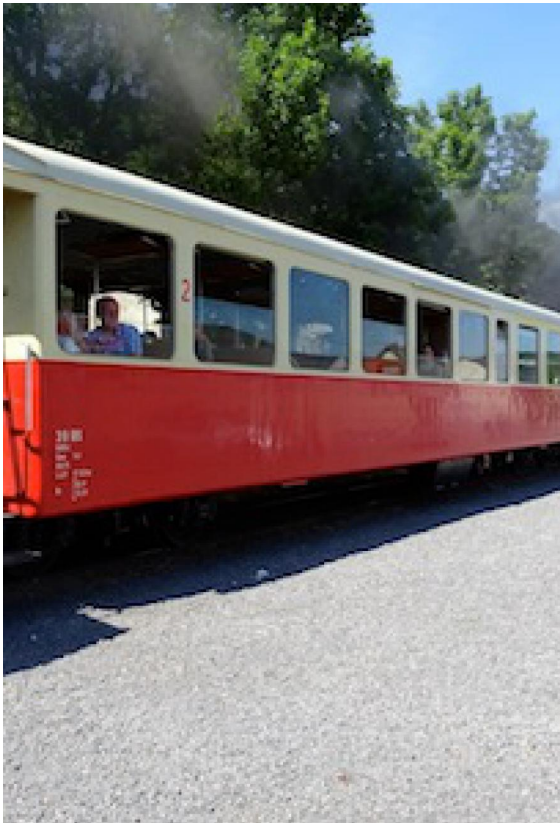
Am Bahnhof Niedertzissen werden die Züge zurück nach Weiler und nach Brohl erreicht.