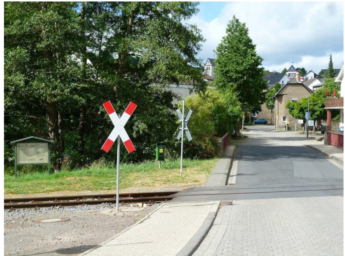
Am Haltepunkt Weiler beginnt die 5. Etappe der Bahnwanderung.