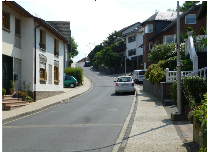
Durch Wohngebiete laufen Sie in Richtung Burgbrohl.