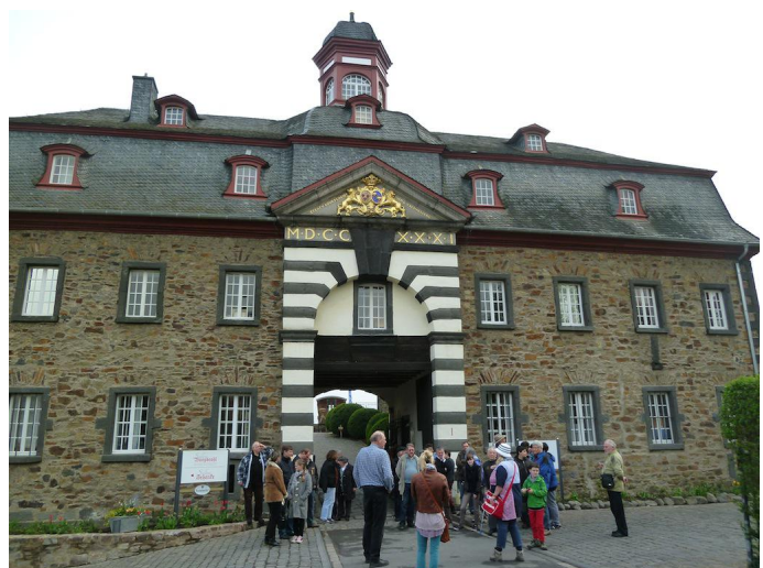
Direkt am Wegesrand liegt das Schloss Burgbrohl mit seiner ausgezeichneten Gastronomie.