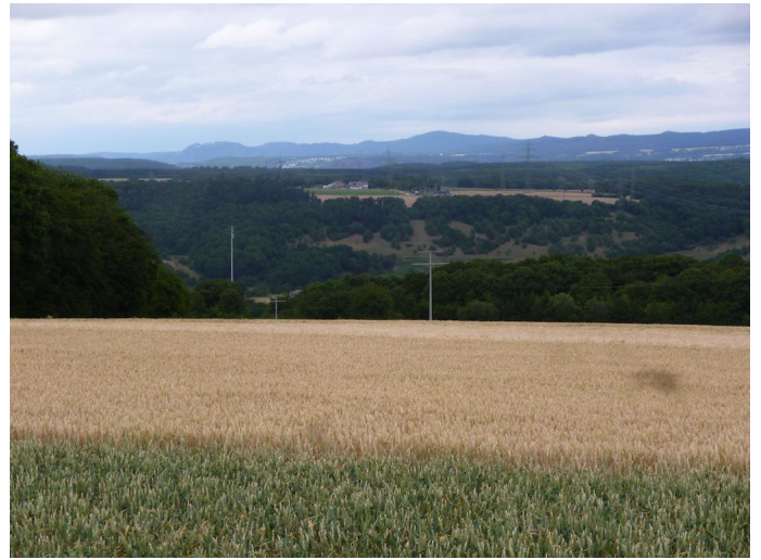
Von hier aus öffnet sich der Blick bis zum Siebengebirge. Autor Michael Hergarten Quelle outdooractive.com-Community