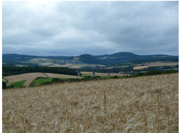
Nach kurzem Aufstieg öffnet sich hinter dem Beunerhof der Blick in Richtung oberem Brohltal.