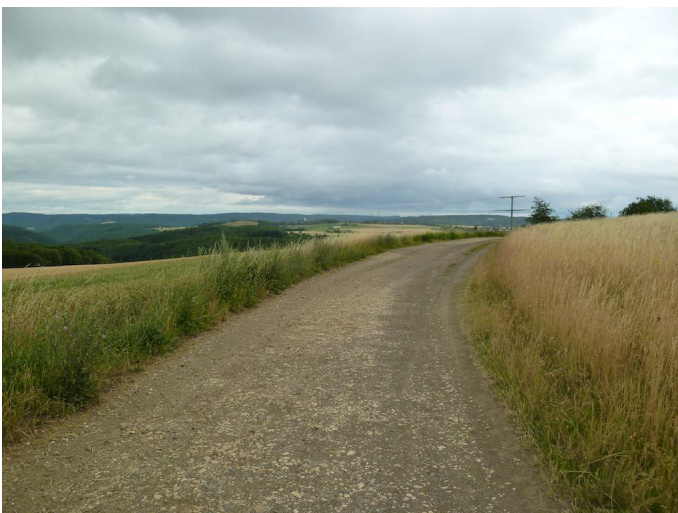
Weg am oberen Abbaurand um die Grube herum.