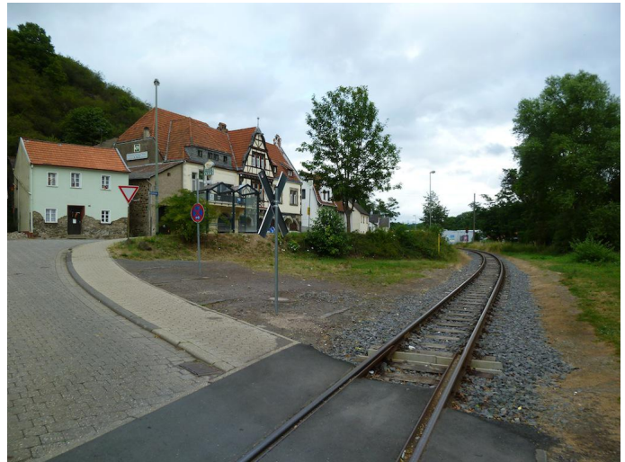
Nach dem Ausstieg kennt es zunächst zur benachbarten Brohltalstraße.