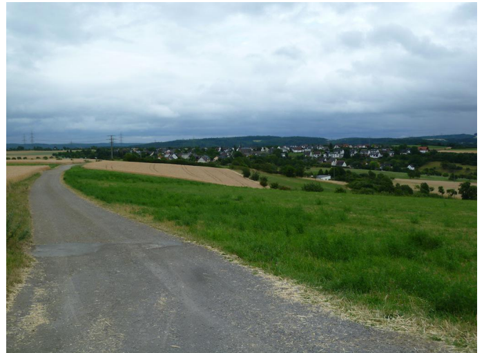
Vom Herchenberg aus führt der Weg nach Oberlützingen.