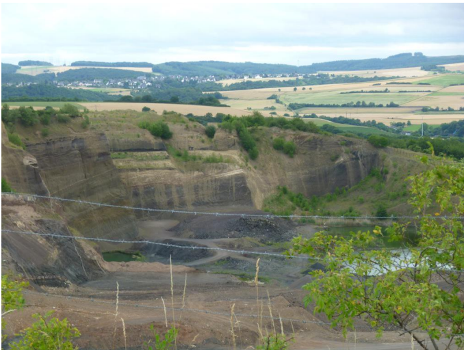
Blick vom Rand der Abbaugrube in die Tiefe.