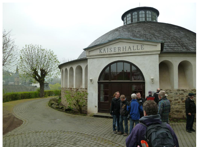
Nach dem Abstieg von Oberlützingen nach Burgbrohl gehts an der Kaiserhalle vorbei. Autor Michael Hergarten Quelle outdooractive.com-Community