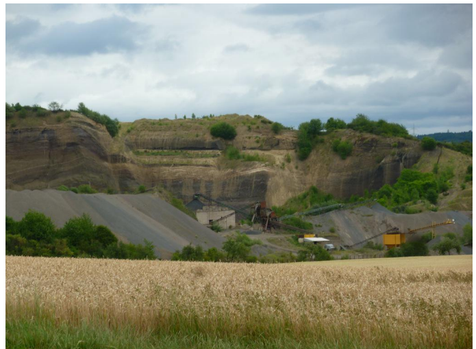
Über die Felder hinweg kann man erste Blicke auf die Lavagrube am Herchenberg erhaschen.