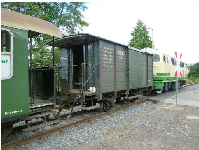
Ein Zug der Brohltalbahn erreicht den Haltepunkt Weiler.