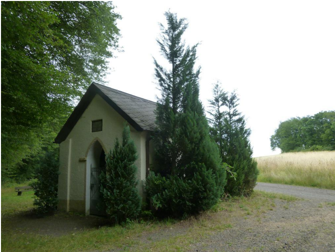
Kleine Kapelle nach Durchquerung eines Waldstücks.