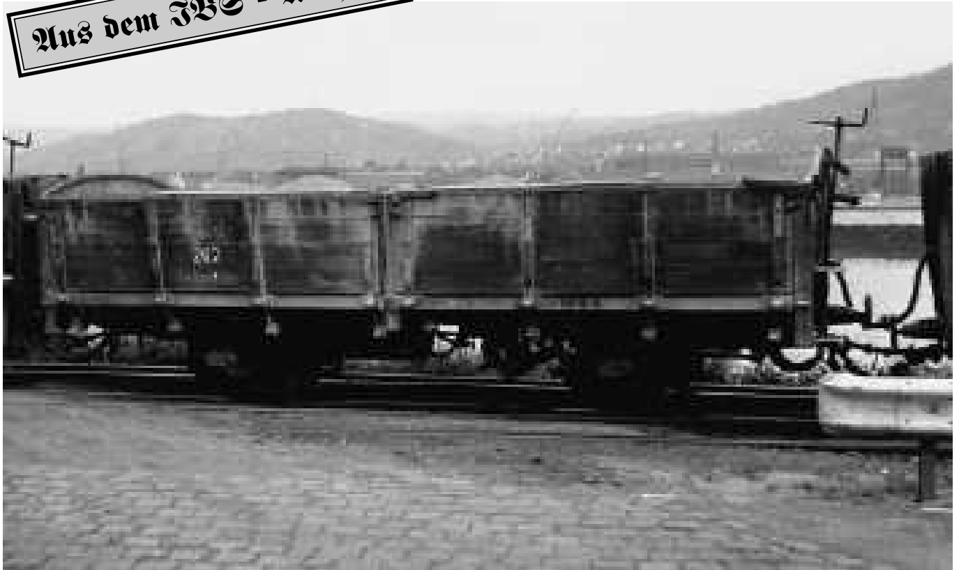
Wagen 02 262 Herbrand; Tragfähigkeit: 15 t