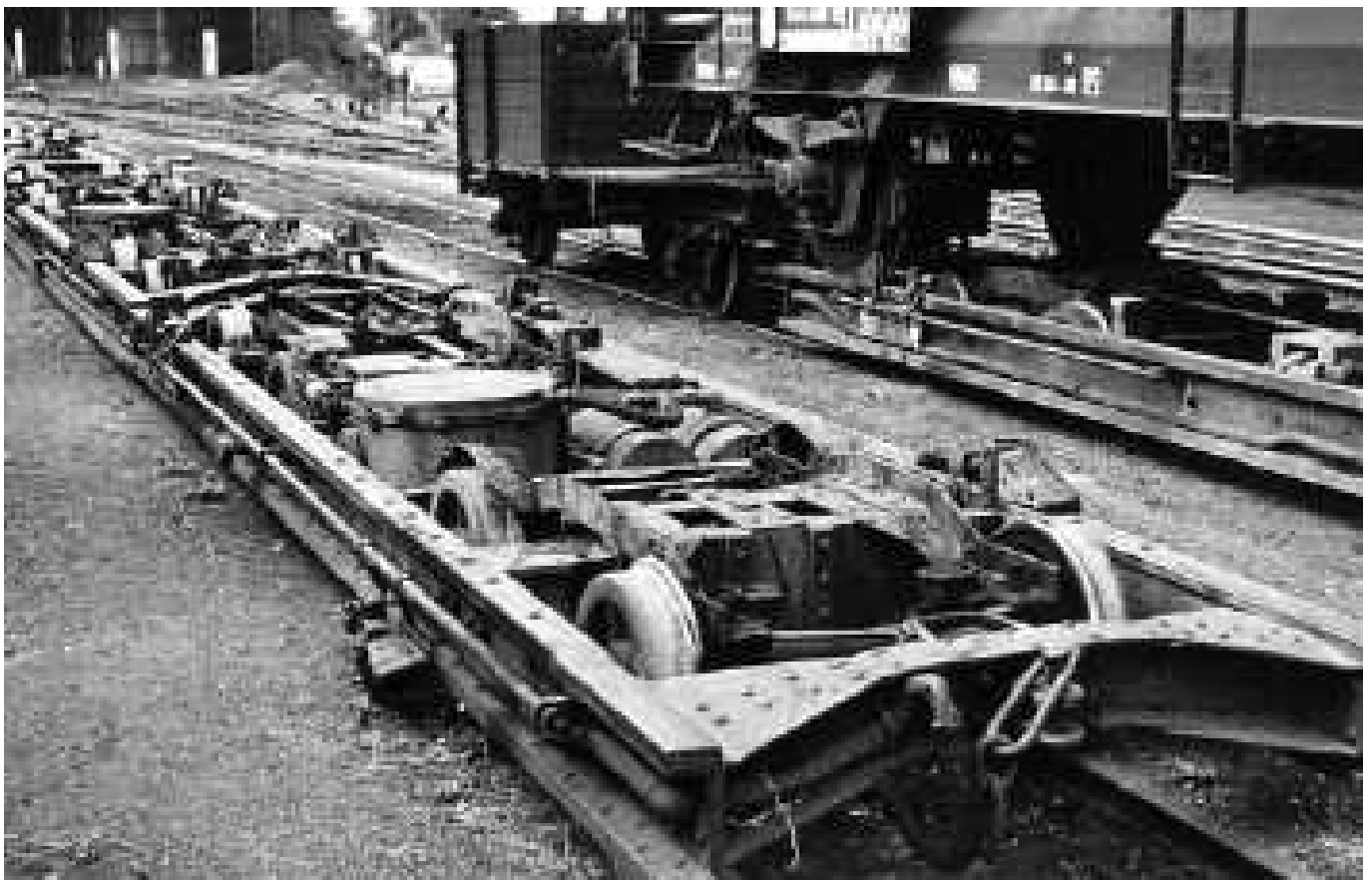
Rollwagen Rw + Kwg 1 ; ex Wuppertaler Stadtwerke 1960;

(Foto: Im Umladebahnhof 08 1964: H.W.Ostermann)