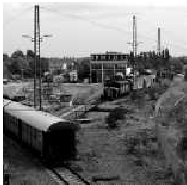
Das neue Museumsgelände mit Rest-Lokschuppen im Gleisdreieck

Des Weiteren wurden ausführlich die Überlegungen und Möglichkeiten zum Neuaufbau des Schuppens