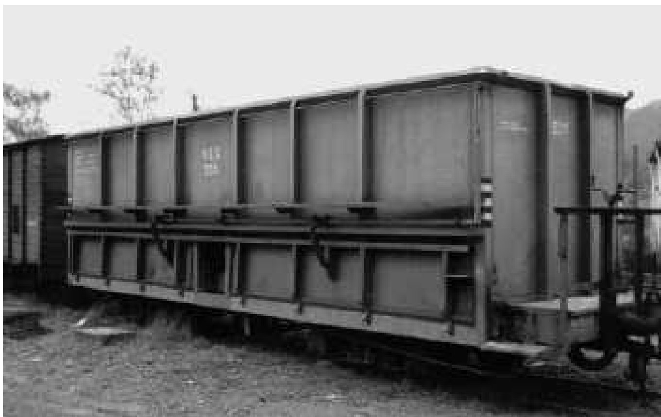
Wagen 00t4 532 ; Schwefer 1961; Tragfähigkeit: 30 t; 1984 nach Malaysia verkauft