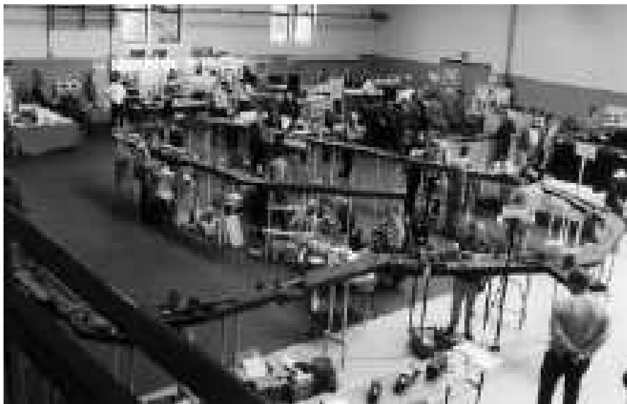
schmalspur expo in der Sporthalle Burgbrohl