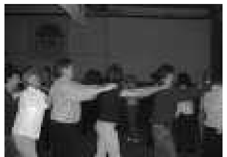
Gambrinusfahrt mit anschließend im Lokschuppen: deftigem Spanferkelessen, Freibier vom Fass, alkoholfreien Getränken, Musik und Tanz bis Mitternacht.

Getränke und musikalische Unterhaltung bis Mitternacht war versprochen; und was trafen die zahlreichen Gäste an? Man kann wirklich nur sagen: „wortgehalten, ALLES VOM BESTEN!“