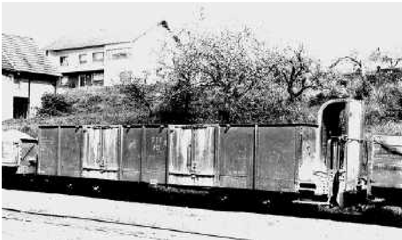
Wagen 00m4 421 ; van der Zypen & Chavlier 1927; Tragfähigkeit 20 t; es Euskirchener Kreisbahn 1967 an BEG