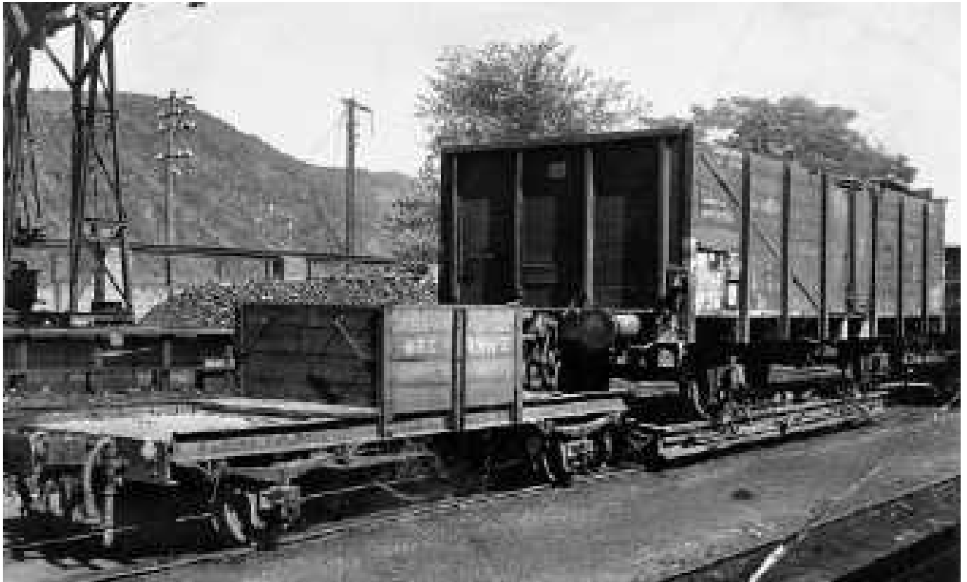
Kuppelwagen Kwg 2 + Rwg ; vermutlich Umbau aus 7,5 t G-Wagen 1931; Abgabe: 1943;