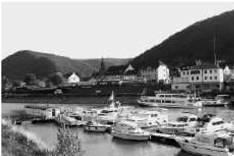
Rheinhafen Brohl mit Personenschiff und dem Vulkan-Express am Ufer