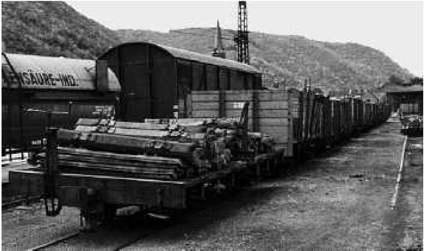
Wagen: HH2 274 ; Both & Tillmann 1899; Tragfähigkeit: 10 t; ex Mödrah-Liblarer-Eisenbahn 328; ab 1960 Baudienst. (Foto: im Umladebahnhof Brohl 08.1964)