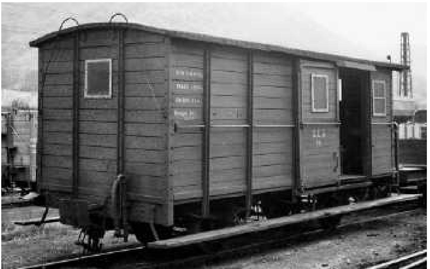
Wagen Pw/Post2 71, ( bis 1929: Nr. 7); van der Zypen & Charlier 1901; Tragfähigkeit: 7,5 t