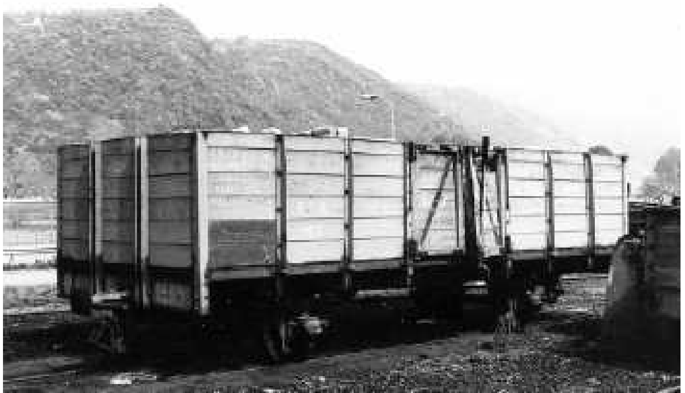
Wagen 02 554 Rastatt 1925; ex Albtalbahn; 1935: ex Fa. Rauen als Privatwagen; 1954 an BEG; Tragfähigkeit: 15 t