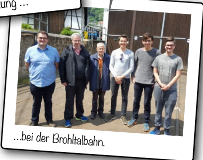
...bei der Brohltalbahn.