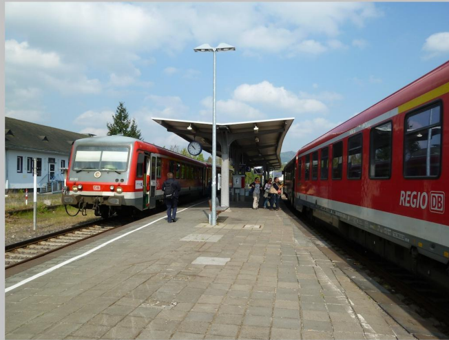
Am Mayener Ostbahnhof besteht die Möglichkeit, auf die RB 38 sowie die RB 23 umzusteigen.