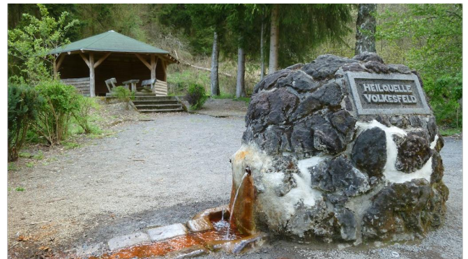
Am Wegesrand im Nettetal liegt die Heilquelle Volkesfeld