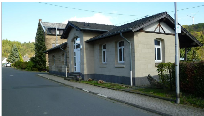
Der ehem. Bahnhof Weibern wird heute als Steinmetzmuseum genutzt.