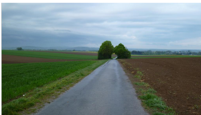
Stetig bergab von Münstermaifeld ins Moseltal