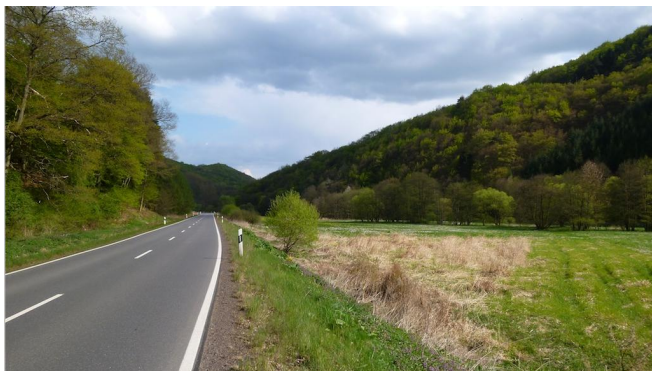
Unterwegs im Nettetal