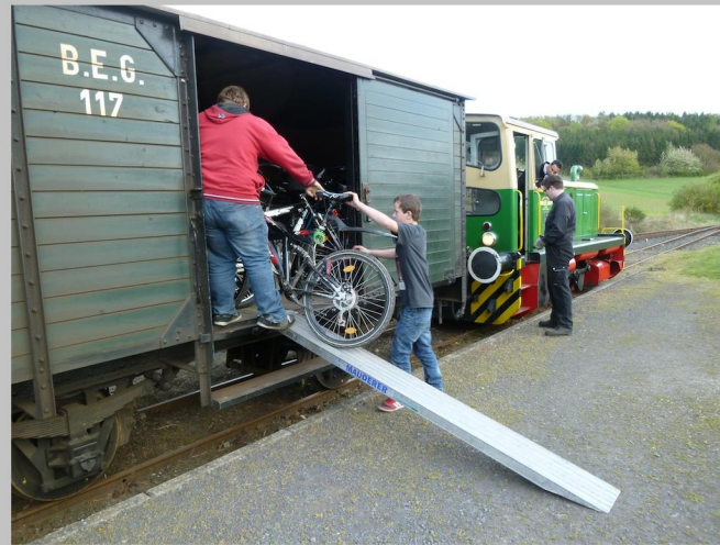
Ausladen der Fahrräder aus dem "Vulkan-Expreß" am Bahnhof Engeln