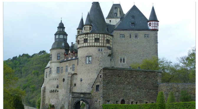
Schloss Bürresheim