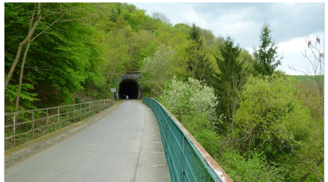
Tunnel statt steil bergauf! Auf ehem. Bahntrassen gehts über das Maifeld.