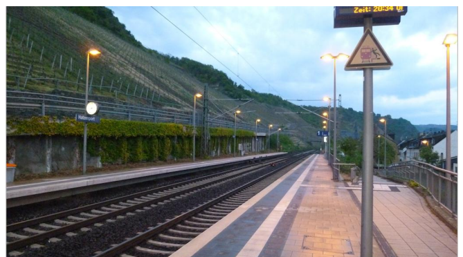
Ziel am Bahnhof Hatzenport (Mosel): stündlich verkehrt hier die RB 81 nach Koblenz und Trier