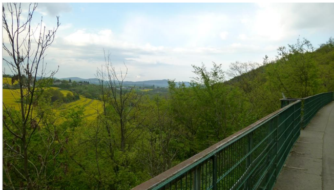
Viadukt auf dem Maifeld-Radweg