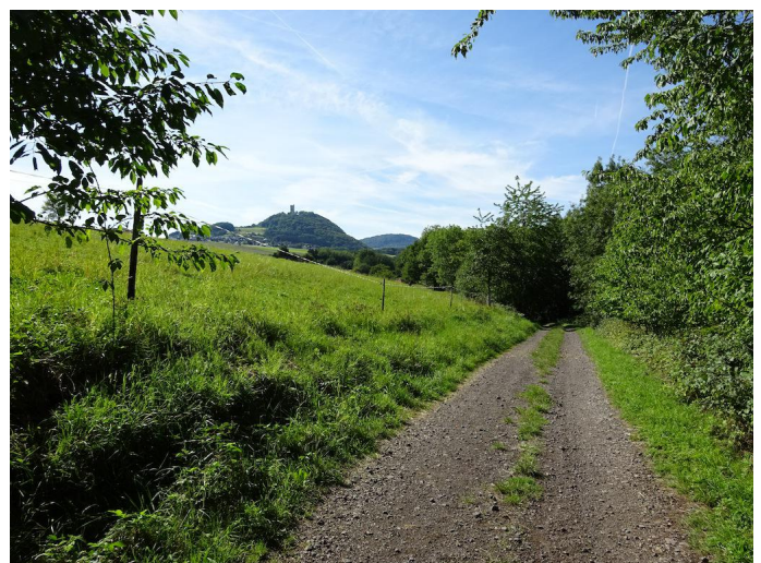
Entlang des Brohlbachs wandern wir weiter nach Oberzissen. Ein Blick zurück zeigt nochmal die Burg.