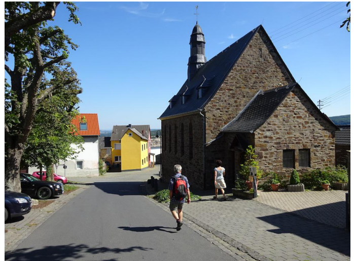
An der Kapelle im Ortskern von Hain treffen wir auf den Brohltalweg "B2".