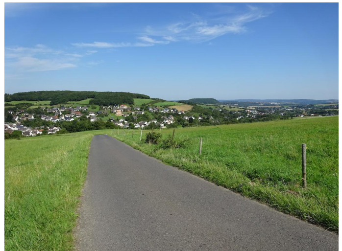
Von Hain geht es abwärts nach Niederdürenbach.