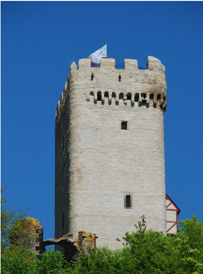
Der Bergfried der Burg Olbrück lockt mit toller Fernsicht.