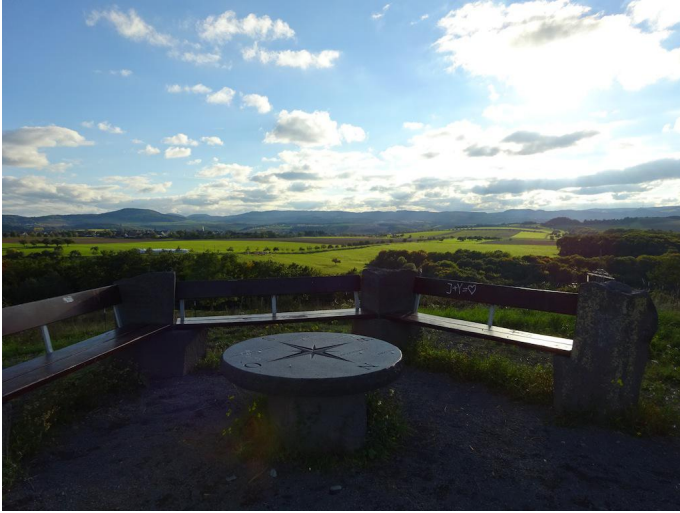
Rastplatz auf dem Steinbergkopf mit tollem Fernblick.