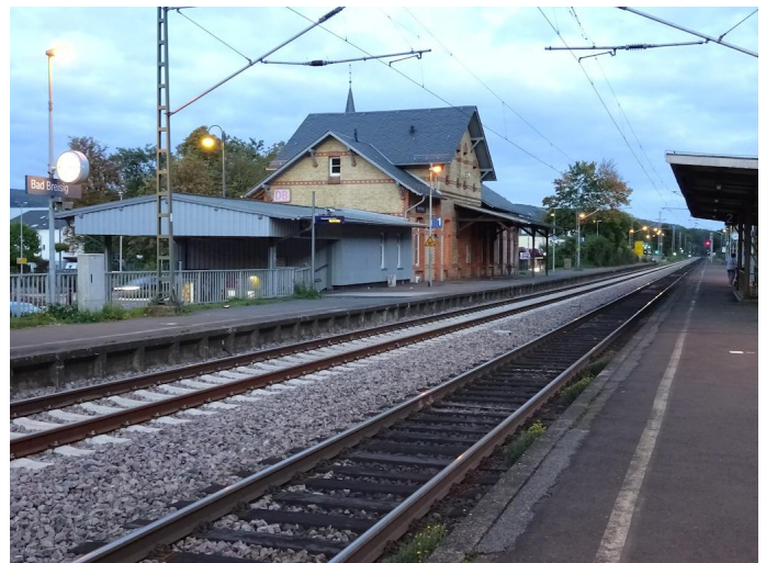
Ziel am Bahnhof Bad Breisig.