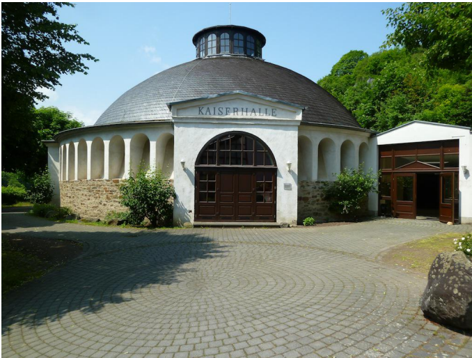
An der Kaiserhalle treffen Sie auf die Wegemarkierung "Q" des Quellenwegs. Autor Michael Hergarten Quelle outdooractive.com-Community