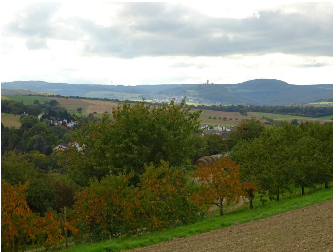
Aussicht über das obere Brohltal.