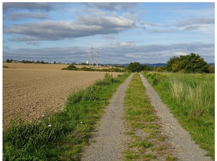
Über die Hochfläche führt der Weg weiter in Richtung Niederlützingen und Steinbergkopf.