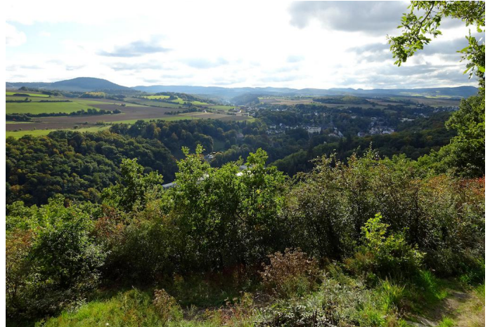
Blick vom Weinberg über das Brohltal.