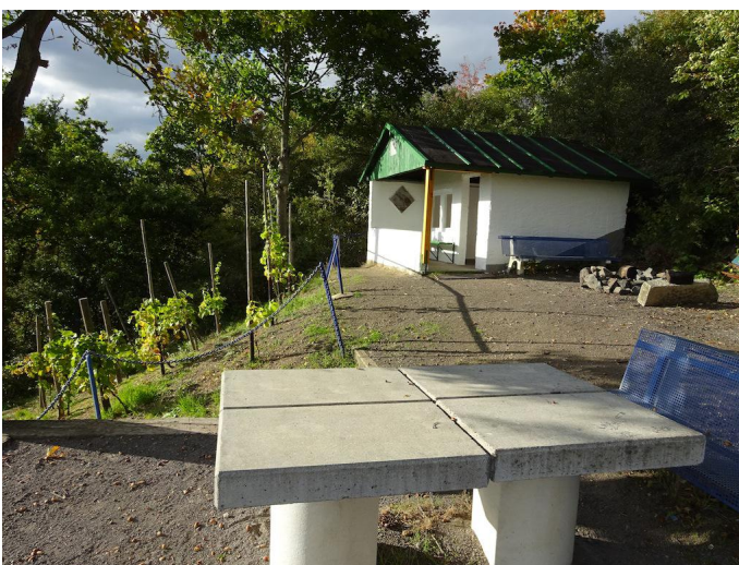
Weinberg mit Grillhütte oberhalb von Burgbrohl.