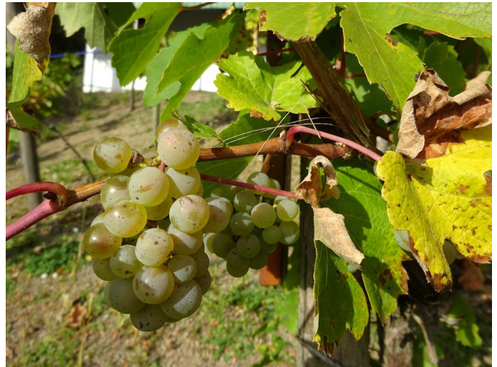
Weintrauben reifen in der Brohltal-Sonne.