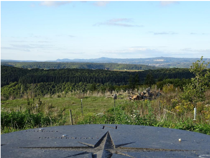
Blick vom Steinbergkopf bis zum Siebengebirge bei Bonn. Autor Michael Hergarten Quelle outdooractive.com-Community