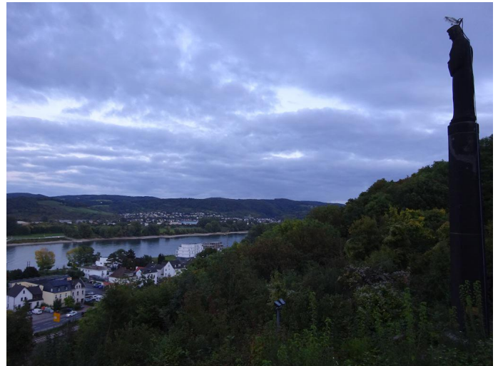
Durch den Wald ist bald die Mariensäule oberhalb von Bad Breisig erreicht.