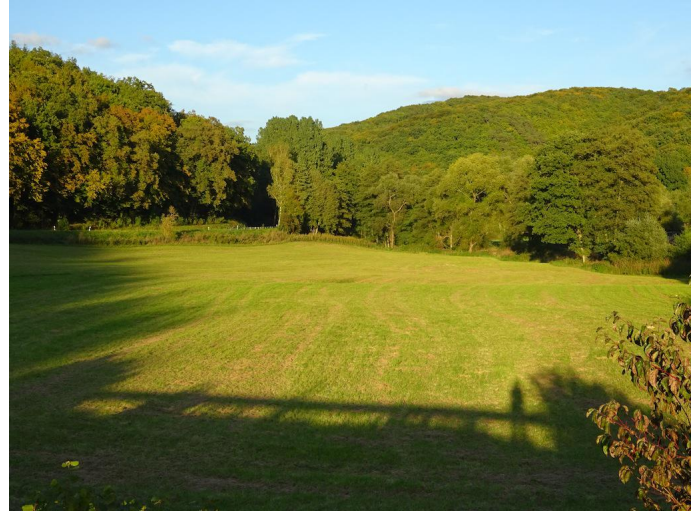
Das Vinxtbachtal wird durchquert, bevor es nochmal bergauf geht..