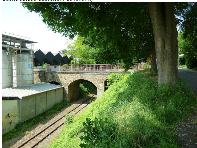
Parallel zur Bahn laufen Sie leicht aufwärts bis zur Kaiserhalle.