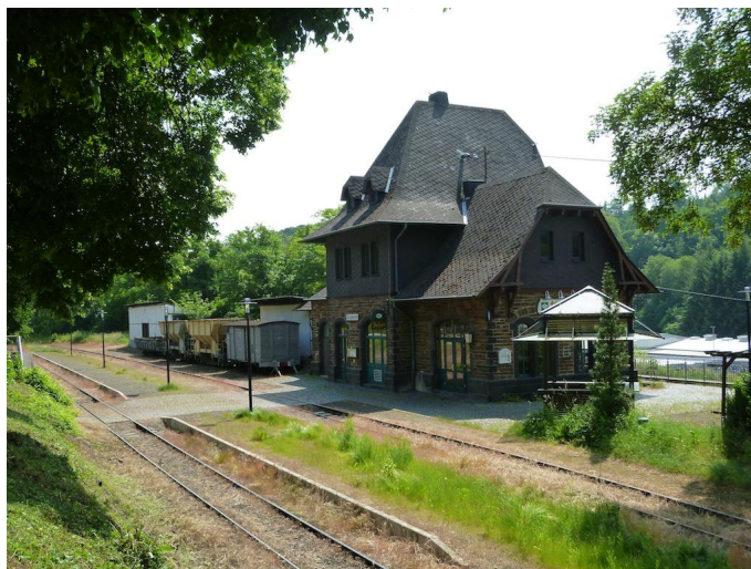
Am idyllischen Bahnhof Burgbrohl beginnt die 4. Etappe der Bahnwanderung.