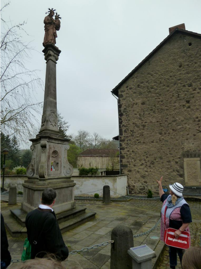
Bald erreichen Sie das Ortszentrum von Burgbrohl.