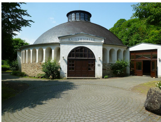
Die einzigartige Kaiserhalle liegt direkt am Weg.