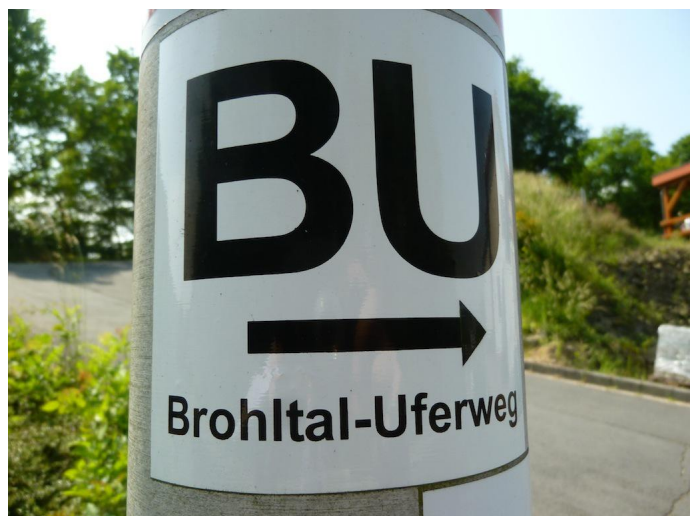
Wegemarkierung "BU" (Schloss bis Weiler)