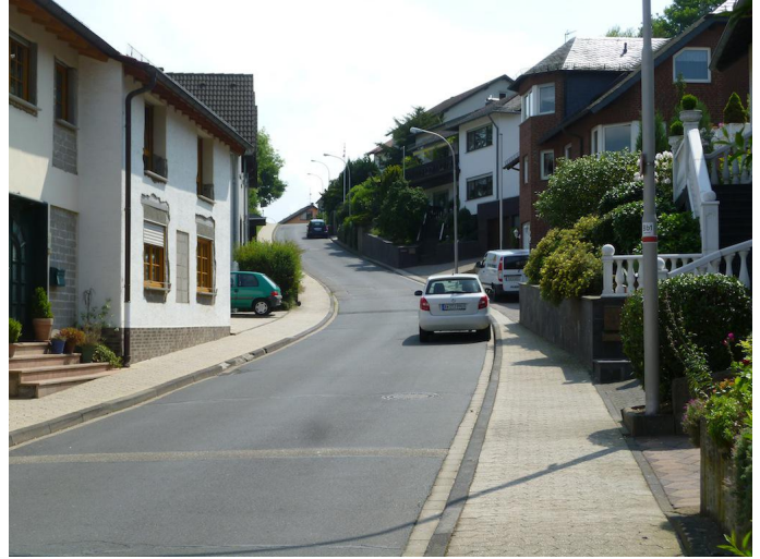
Durch Wohngebiete laufen Sie in Richtung Weiler.