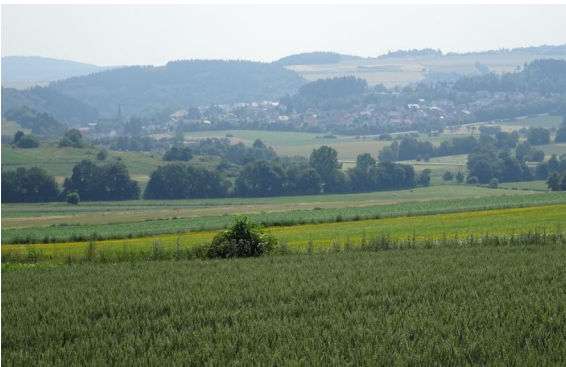
Blick auf Kempenich.