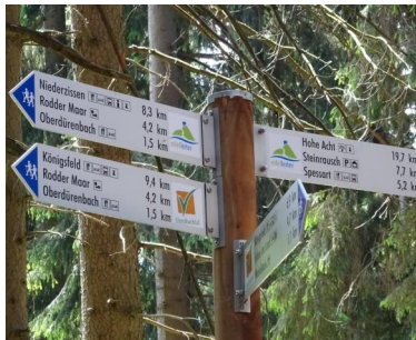
Das Eifelleiter-Beschilderungssystem lässt einen auch im Wald nicht alleine!