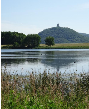
Burg Olbrück spiegelt sich im Rodder Maar.