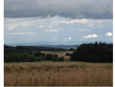
Fernblicke bis hin zum Westerwald ergeben sich zwischen Spessart und Schelborn.