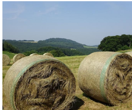
Unterwegs in Richtung Spessart.