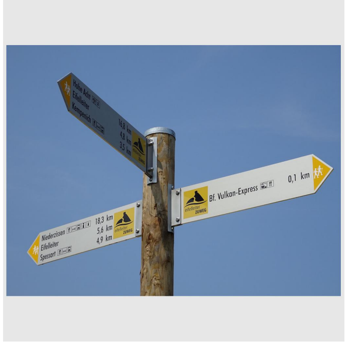
Los gehts: Eifelleiter-Zuweg am Bahnhof Engeln.