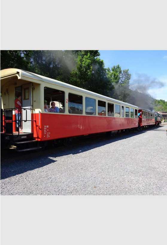
Am Bahnhof Niederzissen erreichen wir wieder den "Vulkan-Expreß" zur Rückfahrt nach Brohl.