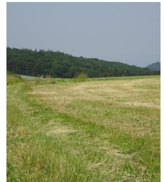
Durch die Wiesen oberhalb von Engeln erhaschen wir einen Blick auf Burg Olbrück.