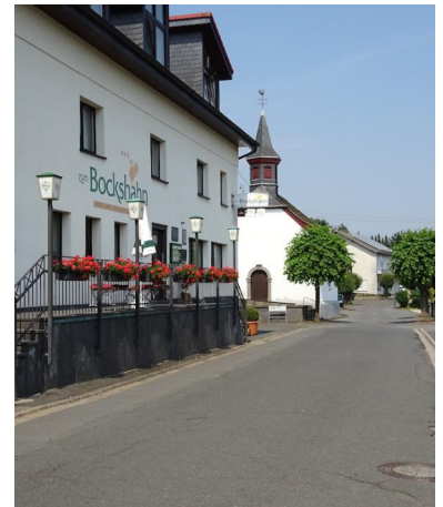
Das Ortszentrum von Spessart lockt mit dem Landgasthof Bockshahn.