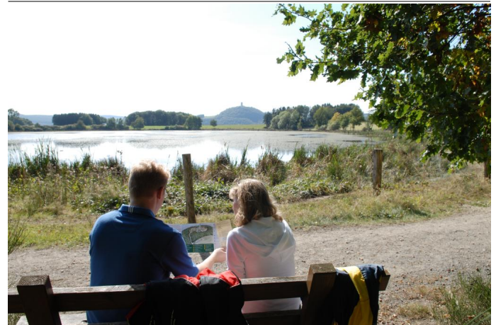
Radt am traumhaften Rodder Maar