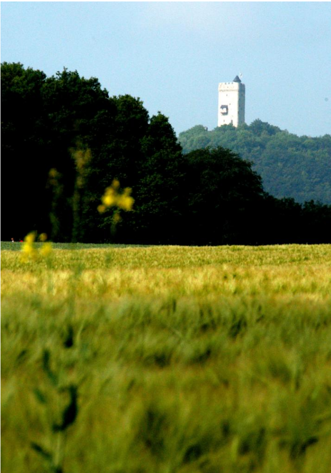
die mittelalterliche Burg Olbrück immer im Blick Autor Sarah Radermacher Quelle Tourist-Information Brohltal