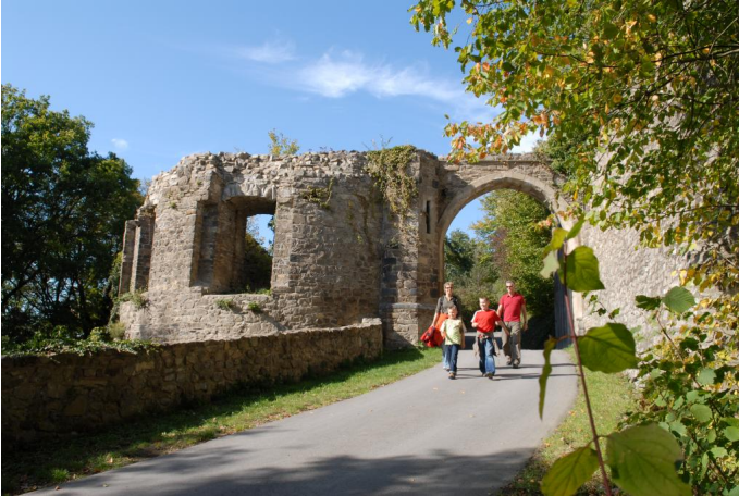
auch Burg Olbrück lädt zu einem Besuch ein Autor Sarah Radermacher Quelle Tourist-Information Brohltal