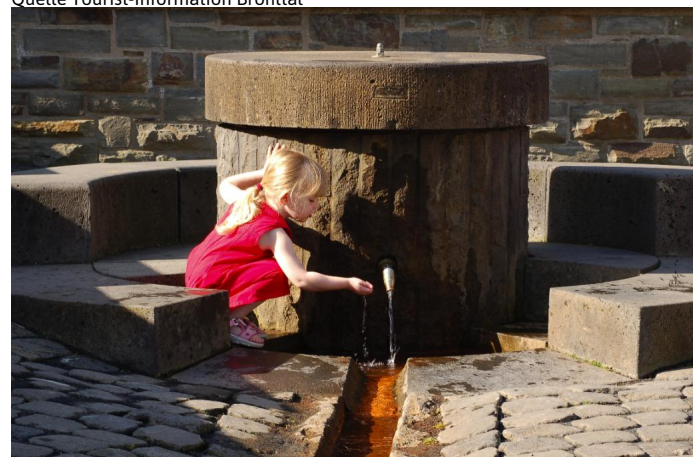
erfrischend und gesund - Wasser aus dem Buhr