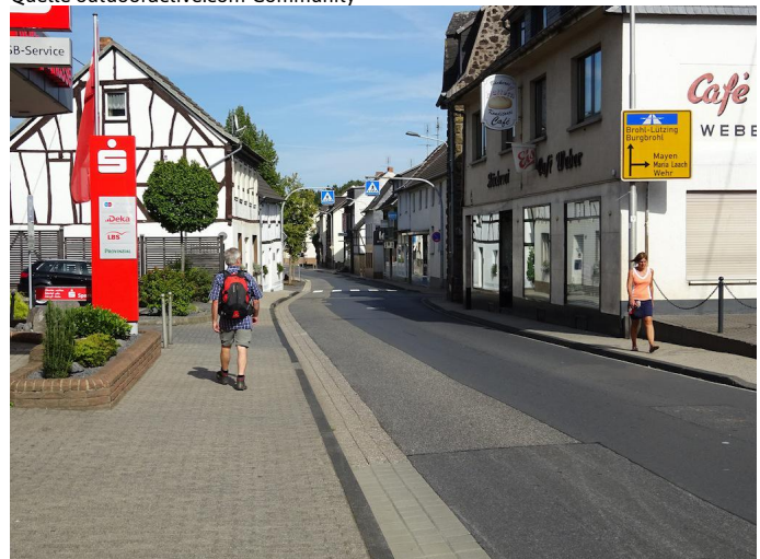
Entlang der Brohltalstraße geht es zunächst durch den Ortskern.