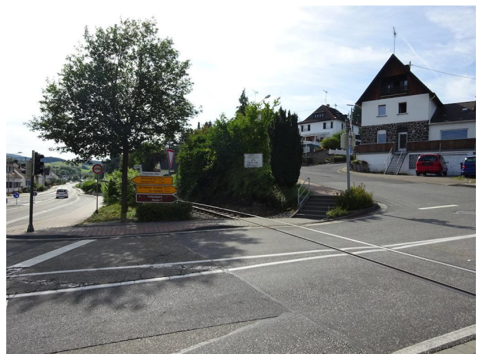
An der Königsfelder Alle überqueren Sie den Bahnübergang.