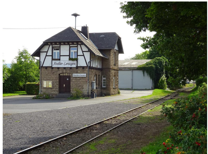
Am Bahnhof Niederzissen beginnt die 6. Etappe der bergwärts führenden Bahnwanderung.