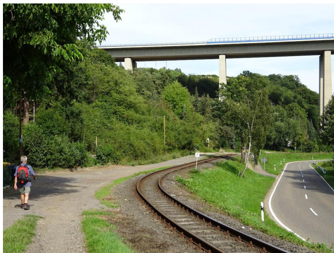
Unterquerung der mächtigen Brücke der A61.