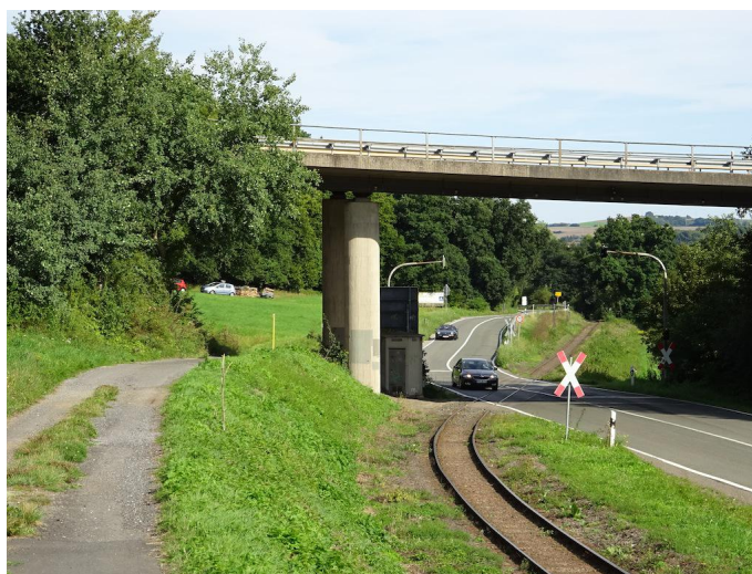
Auf Höhe des Autobahnzubringers wechseln Sie am Bahnübergang die Straßen- und Bahnseite.