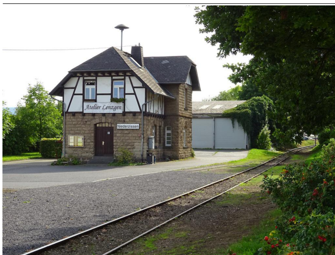
Am Bahnhof Niederzissen beginnt die 4. Etappe der talwärts führenden Bahnwanderung.