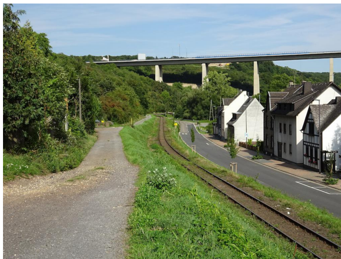
Oberhalb der Gleise führt der Weg parallel zur Bahn in Richtung Weiler.