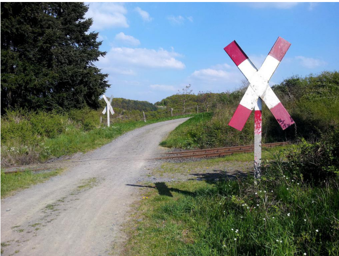
Nach der Umrundung einer Pferdekoppel wird erneut das Gleis gekreuzt.