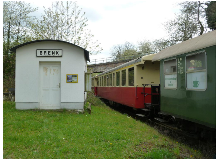
Das Ziel, der Bahnhof Brenk ist erreicht.