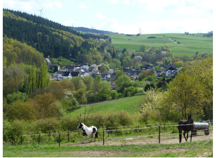
Blick auf Brenk