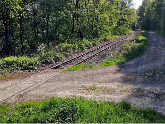
Im Quackenforst wechselt der Weg über einen kleinen Bahnübergang die Gleisseite.