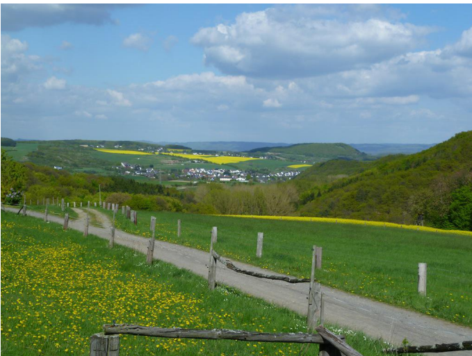
Blick von oberhalb des "Quackenforstes" ins Brohltal.