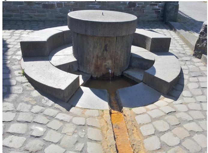
Am Sauerbrunnen in Oberzissen kann man quellfrisches eisenhaltiges Mineralwasser probieren.