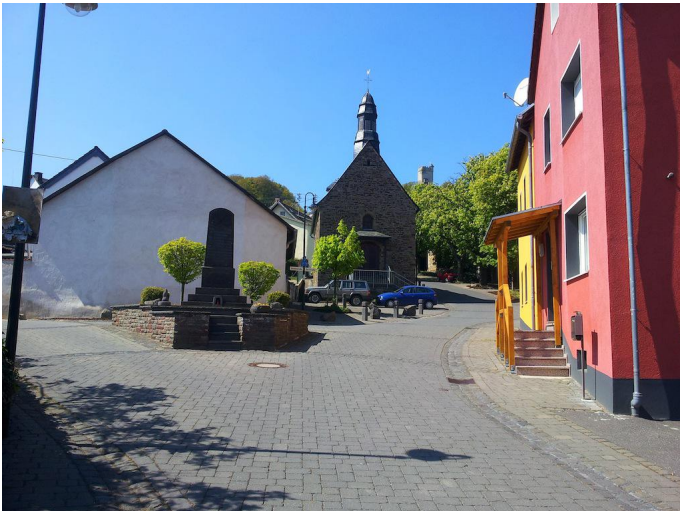
Vom Kriegerdenkmal an der Kapelle von Hain führt der Weg von der Sonnenstraße bergauf in die Dorfstraße.