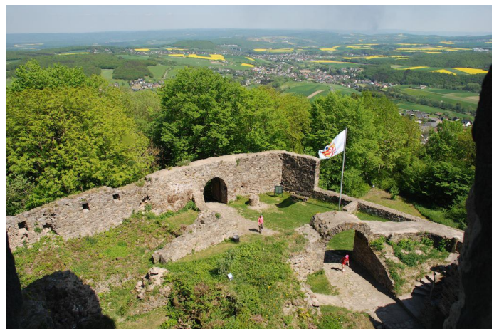
Bei günstigem Wetter kann man einen Großteil der Kölner Bucht überblicken.