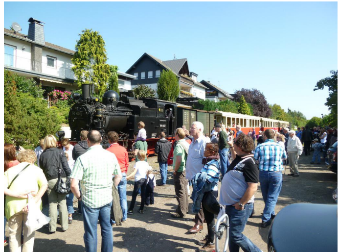
Ein dampfbespannter Zug aus Brohl erreicht den Bahnhof Oberzissen.