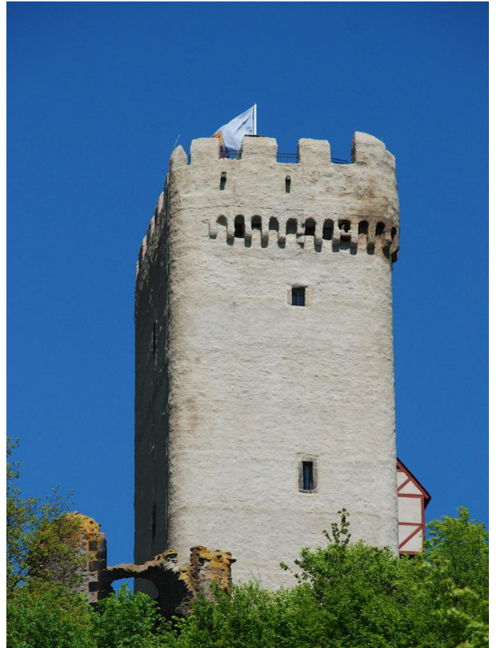
Der 34 Meter hohe Bergfried kann bestiegen werden. Er ist das weithin sichtbare Wahrzeichen der Burg.