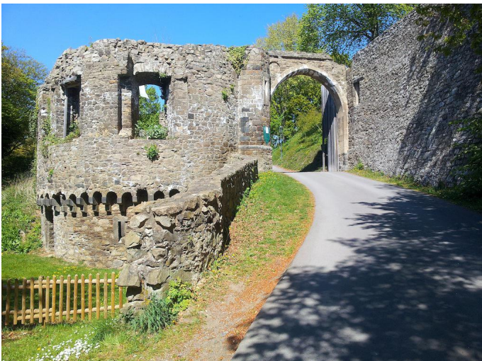
Durch das Tor in der ehemaligen Vorburg gelangt man hinauf zur eigentlichen Buranlage.