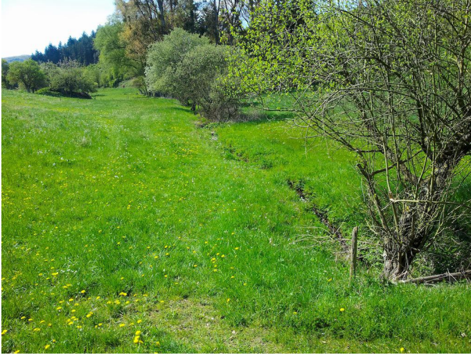
Das Quackenbachtal mit seinen saftigen Wiesen ist ein Seitental des Brohltals.