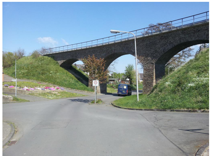
Am Ortsrand von Oberzissen unterqueren Sie den Viadukt der Brohltalbahn.