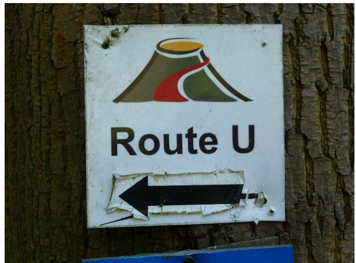
Wegemarkierung "Geo U"