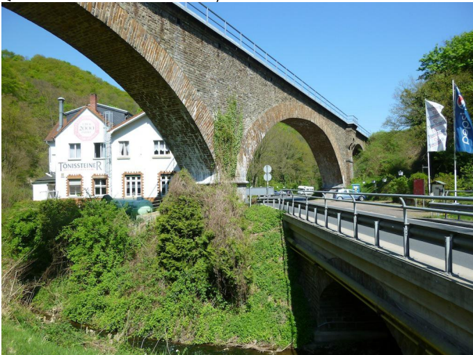
Unterhalb des mächtigen Viadukts wird zunächst die Straße überquert.