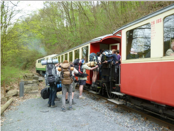
Am kleinen Haltepunkt Bad Tönisstein beginnt die dritte bergwärts führende Etappe der Bahnwanderung.