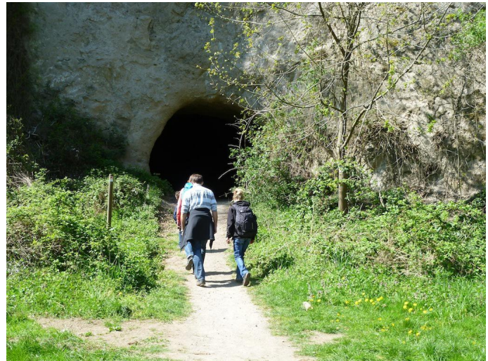
Der Weg führt direkt in die Trasshöhlen.